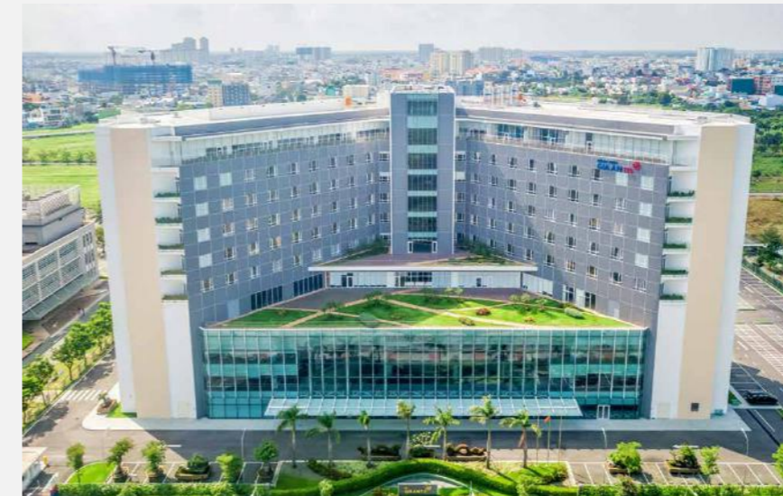
DỰ ÁN: Bệnh viện Gia An Gia An Hospital