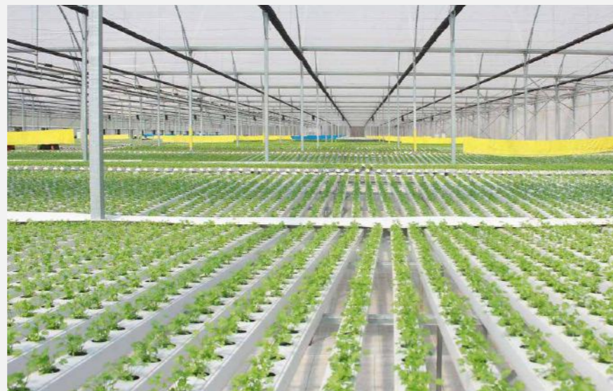
DỰ ÁN: Công ty TNHH Đầu tư Phát triển Sản xuất Nông nghiệp VinEco VinEco Agricultural Development Investment Company ("VinEco")