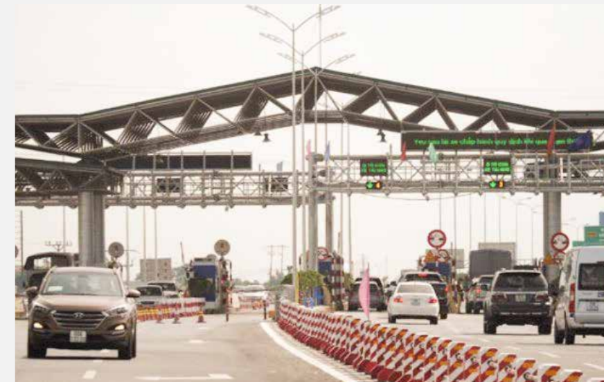
DỰ ÁN: BOT Hà Nội - Bắc Giang Hanoi - Bac Giang BOT