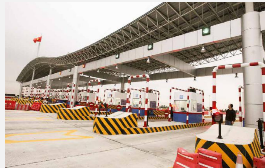
DỰ ÁN : BOT QL1 qua Ninh Thuận theo HĐ BOT NH1 BOT through Ninh Thuan under BOT contract