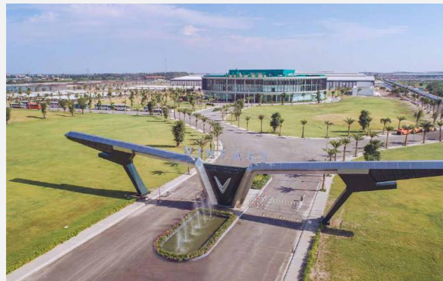
DỰ ÁN: Công ty TNHH Sản xuất và Kinh doanh VinFast VinFast Manufacturing and Trading Company Limited