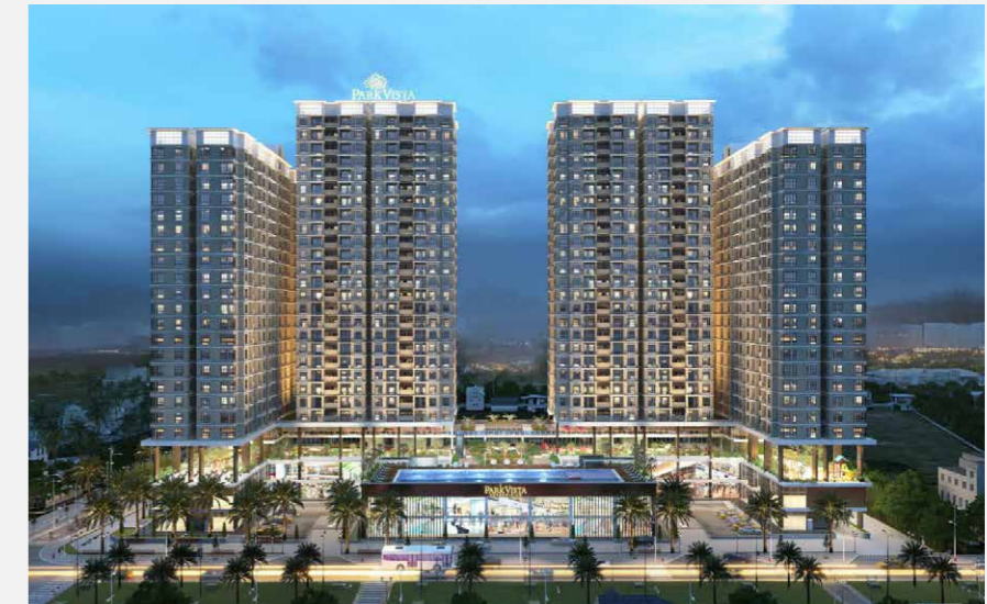
DỰ ÁN: Khu dân cư Đông Mê Kông East Mekong residential area