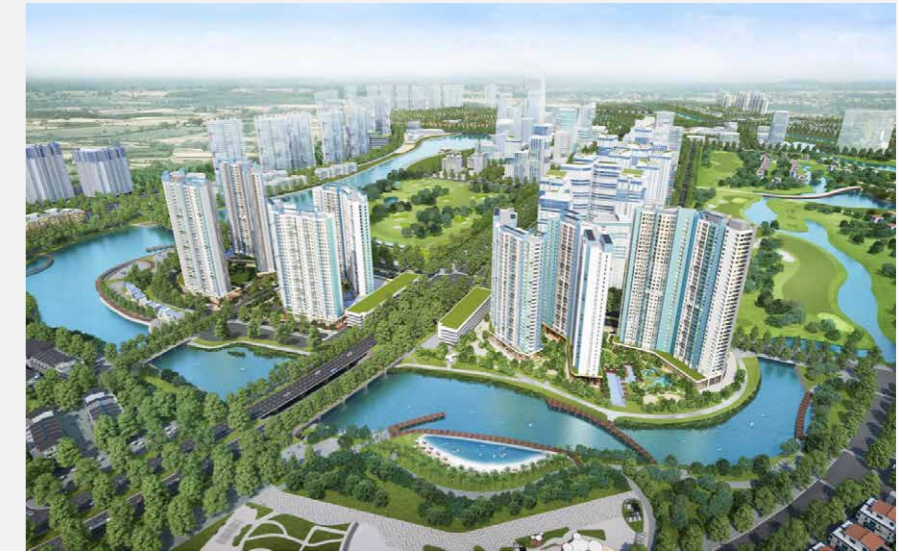
DỰ ÁN: Khu đô thị Ecopark Ecopark township