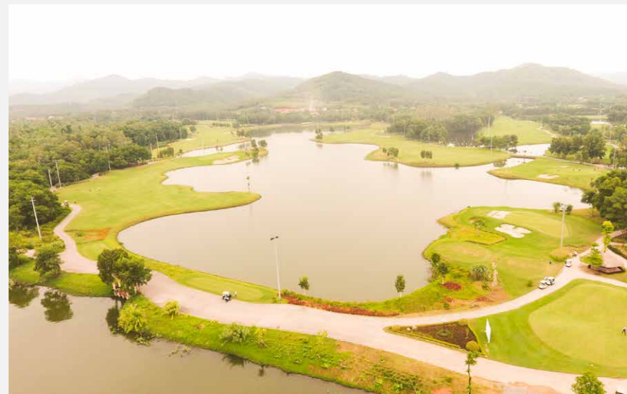
DỰ ÁN: Sân golf Đại Lải Đại Lải Star Golf & Country Club