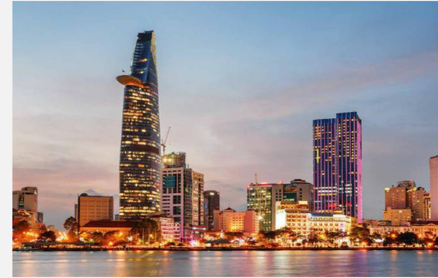
DỰ ÁN: Công ty TNHH Tập đoàn Bitexco Bitexco Group Company Limited