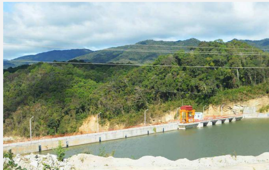
DỰ ÁN: Nhà máy thủy điện Krông Nô Krong No hydroelectric plant