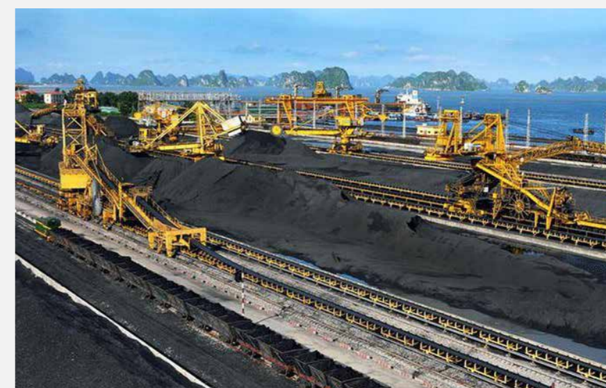
DỰ ÁN: Tổng Công ty Công nghiệp Hóa chất mỏ - VINACOMIN Vinacomim - Mining Chemical Industry Holding Corporation Limited